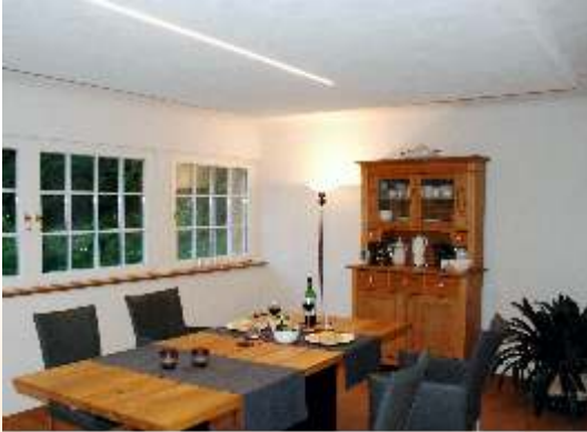
Trockenbaumodule abgesetzt als „Deckensegel“ installiert mit integrierter Beleuchtung (dimmbare LED-Leiste)