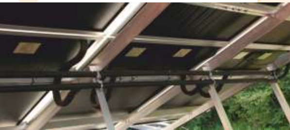
Modulrückseite mit Hydraulik, aufgeständert (Montagebeispiel)